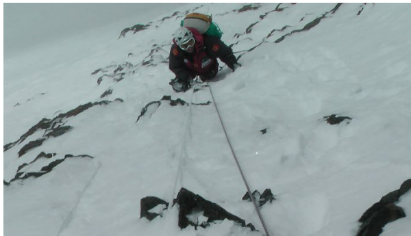
Gerlinde kurz vor Schulter