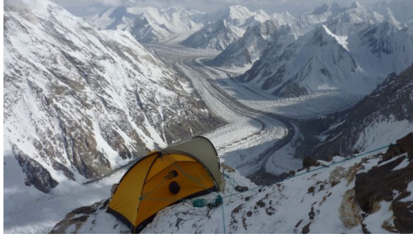
Wie in einem Adlerhorst auf ca. 7.100 m

Eine windstille Nacht lag hinter uns. Jedoch schon um 8.00 Uhr meldete sich der starke Wind zurück. Wir wollten erst noch eine weitere Nacht hier oben verbringen. Nachmittags kam leichter Schneefall dazu und so entschieden wir, abends doch noch abzusteigen. Würde womöglich wieder Neuschnee dazu kommen, wäre der Hang unter unserem Biwakplatz einfach zu Lawinen gefährlich.